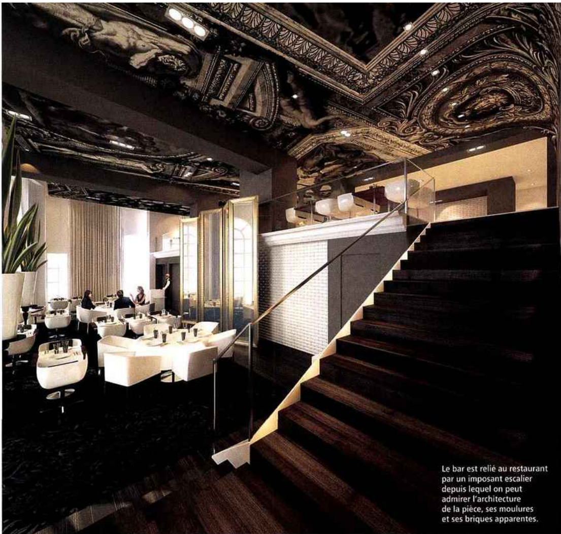
Le bar est relié au restaurant par un imposant escalier depuis lequel on peut admirer l'architecture de la pièce, ses moulures et ses briques apparentes.