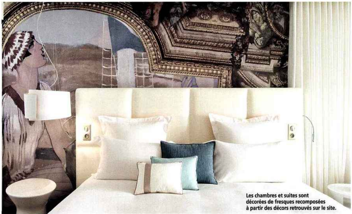
Les chambres et suites sont décorées de fresques recomposées à partir des décors retrouvés sur le site.