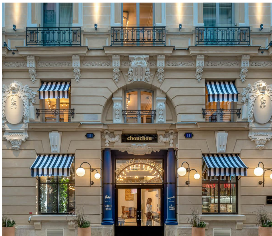
Façade du Chouchou Hotel, à côté de l'Opéra Garnier.

Le Chouchou Hotel est un petit joyau sans prétention de la scène hôtelière parisienne. Niché dans une ruelle près de l'Opéra Garnier et à cinq minutes à pied du boulevard Haussmann, ce joli bâtiment en pierre possède deux entrées. La première mène au restaurant de l' hôtel , ouvert à tous, conçu dans un style guinguette et orné de lumières scintillantes et de nombreuses plantes. Souvent, un grand écran est installé pour suivre les