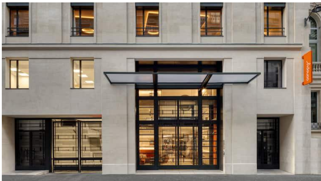
Façade du Canopy Trocadéro.