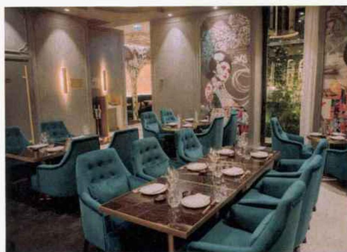
YAKUZA BY OLIVIER