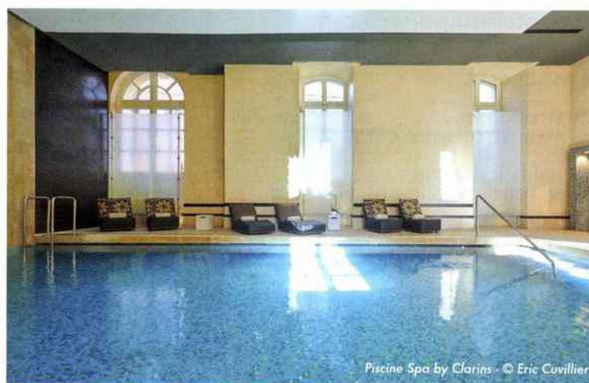
Piscine Spa by Clarins - © Eric Cuvillier

Le soin exclusif "Clarins en Provence" , associant hammam, gommage aux poudres de plantes et modelage ressourçant aux pochons de lavande, vous mènera au bord de l'extase !