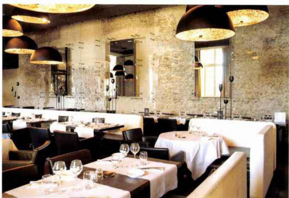
Restaurant Les Fenêtres