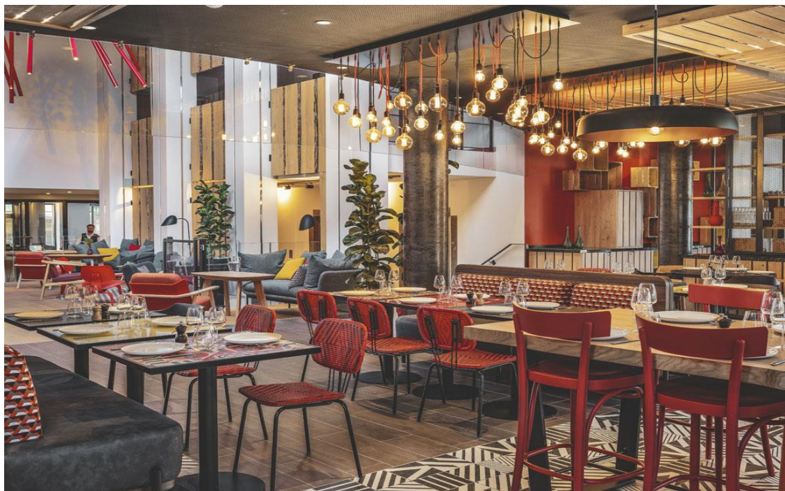
Espace F&B Novotel Paris Vaugirard Montparnasse

La volonté du groupe à travers cette rénovation était de créer un véritable lieu de vie, en permettant notamment à l'hôtel de s'ancrer dans le quartier de Vaugirard. La nature est ainsi omniprésente dans tout l'établissement et chaque espace est conçu pour être modulable, certaines suites se transforment en salles de réunion. Le studio Jean-Philippe Nuel a également imaginé le « Nid », une structure qui coiffe le roof-top Ilvolo, lieu hybride, à la fois bar, terrasses et espaces de réunions.