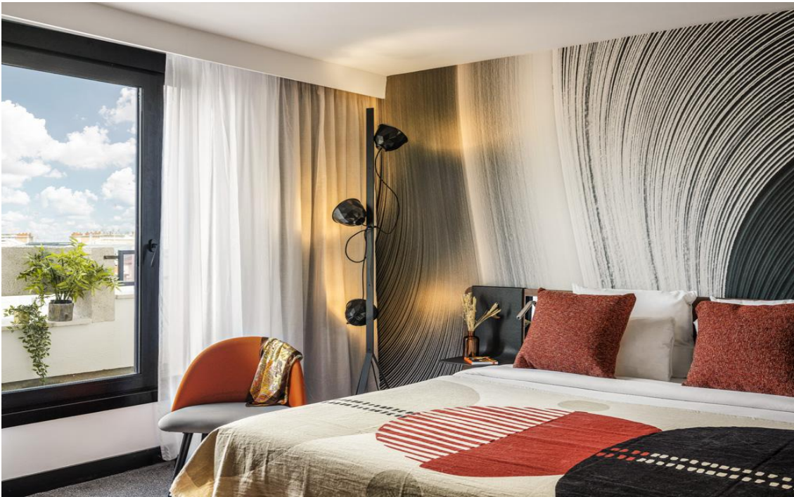
Chambre Novotel Paris Vaugirard Montparnasse

Ce vaste chantier de rénovation a été porté par les équipes AccorInvest, celles de son partenaire Accor mais également celles du studio Jean-Philippe Nuel . L'adresse a ainsi été entièrement repensée pour offrir une véritable expérience lifestyle. au cours de 18 mois de travaux, 187 chambres ont été rénovées tandis que 8 chambres et 3 suites conférence ont été créées