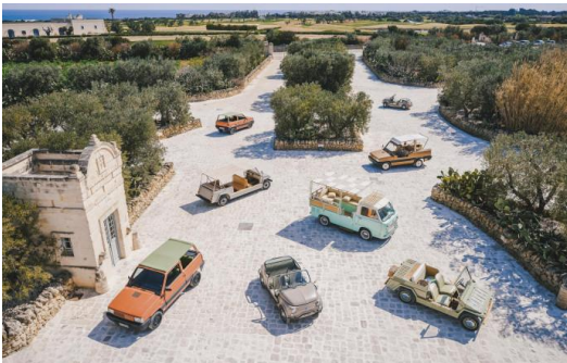
Le charmant parc automobile du Borgo Egnazia. www.borgoegnazia.com Borgo Egnazia

Borgo Egnazia, hôtel paradiso dans les Pouilles. Ce domaine familial niché dans les Pouilles tient autant du petit village de charme que du resort de luxe. Devenu en onze ans le rendez-vous des amoureux du farniente à l'italienne et de la dolce vita version calme, Borgo Egnazia mêle légèreté, insouciance et art de vivre. Soleil, pasta et élégance... le paradis ! Lire la suite de l'article →