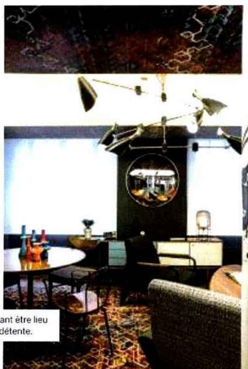
Un espace pouvant être lieu de travail ou de détente.

"J'ai voulu écrire une histoire pour un hôtel qui soit en phase avec son époque. Il répond à une clientèle jeune, habituée aux nouvelles technologies."