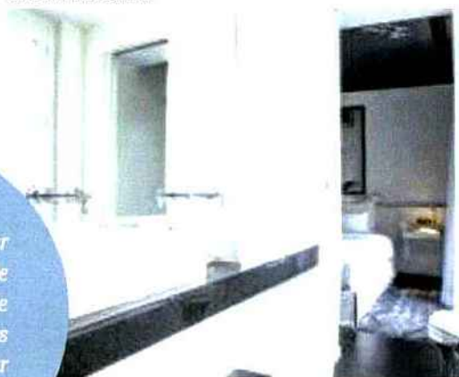
Une salle de bains.

” J'ai voulu raconter une histoire qui parle à cette nouvelle génération de voyageurs qui se rencontrent sur Facebook.”