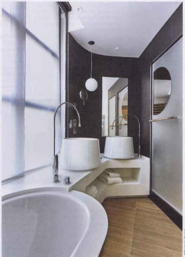
HÔTEL LE 5 CODET PARIS. AGENCE NUEL.

Quelles sont vos priorités pour son aménagement ? La quête de lumière naturelle est pour moi une priorité, ce qui a pour effet de positionner la salle de bains dans l'espace de différentes façons. Je travaille aussi des configurations variées afin que le client puisse choisir, un hôtel s'adressant à différents types de clientèle (business, loisir, famille) tout au long de l'année. On peut donc de façon tout à fait classique rentrer dans une chambre avec une salle de bains séparée ou inscrire la salle de bains dans la chambre avec une baignoire en îlot pour profiter d'un feu de cheminée ou d'une vue exceptionnelle. Cette dernière se complètera alors d'une douche fermée