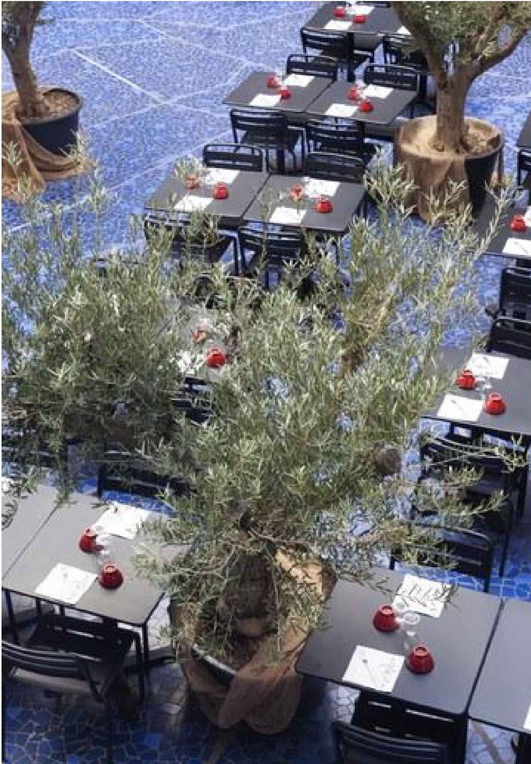
Que faire à Marseille?