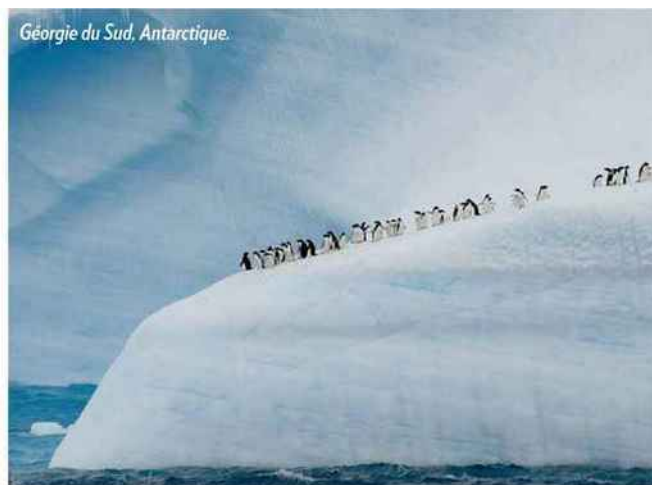
Géorgie du Sud, Antarctique.