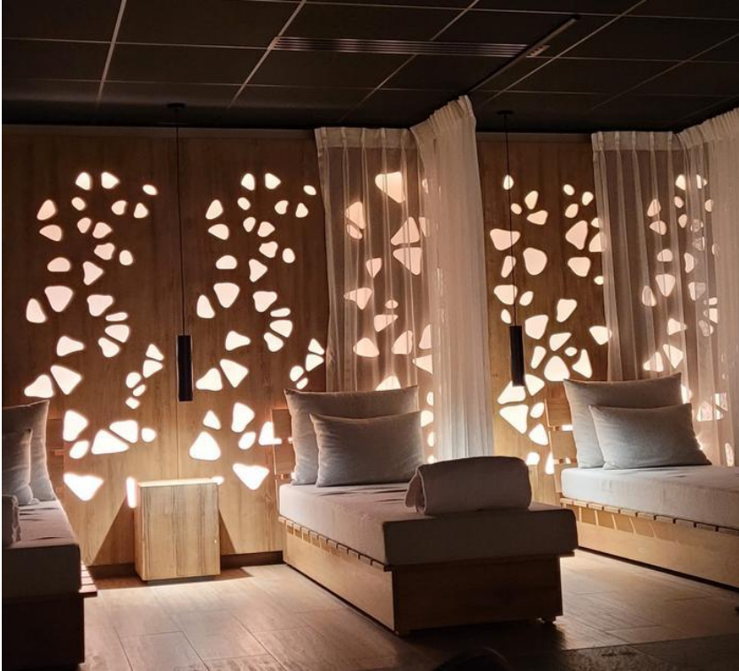
Cabine de repos du spa Sothys.

À ce même rez-de-chaussée, on trouve, outre une boutique de mode, axée sur les tenues de montagne (avec de belles marques comme Bogner et Fusalp), le spa Sothys . Un long couloir dessert 11 cabines, superbes, dans des tons marron, qu'éclaire un plafond peint d'une sorte de ciel au bleu électrique. Les lits de massage sont chauffants, ce qui est bien agréable et la salle de repos, juste après un hammam exclusif, est très belle, avec sa tisanerie organisée autour d'un samovar. Côté soins, la marque corrézienne a mis au point un spécial « Récupération ski », qui existe en version deux jours ou trois jours. « Il s'agit d'un massage du corps de 50 minutes, combinant des manoeuvres à visée drainant, pour favoriser la récupération musculaire », explique le dirigeant de Sothys, Christian Mas, qui signe là son premier spa à la montagne. Un soin particulièrement bien adapté, au retour des premières descentes (pack 2 jours : 180 €, pack 3 jours : 270 €).