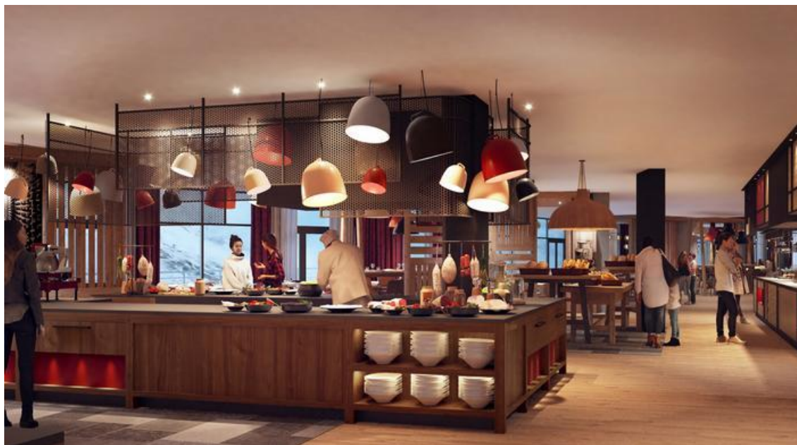
Le Val Claret, un des deux restaurants du Club.

Au troisième étage, accessible du lobby, le restaurant Le Val Claret , se présente comme une cantine immense, où là encore on a fait comme on a pu, pour la rendre cosy. Des sortes d'abris ajourés, où se logent quelques tables, rythment cette immense salle à manger construite en arc de cercle avec quelques recoins. Cela nous rappelle notre enfance, quand on construisait une cabane dans sa chambre... Et, tradition Club Med oblige, s'y étalent des buffets en tout genre. Celui des pâtisseries et du fromage, reste les plus impressionnant par la variété et l'opulence de leur contenu. Tout est plutôt de bonne qualité, mais les files d'attente, aux heures d'affluence, rendent pénibles l'accès aux buffets. Certains visiteurs se promènent hagards avec leurs assiettes à bout de bras. Comme nous dit notre voisin, « j'ai finalement pris du poulet, car c'est là où il y avait le moins de monde » ! Dommage. On trouve un second restaurant, deux étages au-dessus, Le Solstice . Cette table bistrannique, en circuit court et sur réservation, est incluse dans la formule « tout compris », sans supplément donc. Un service efficace et souriant permet de renouer avec les plaisirs du restaurant, dans un décor ravissant, très montagne, que rend intime un éclairage subtil.