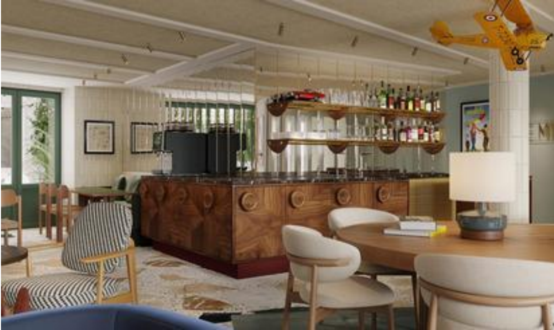
Hôtel Paris-Montmartre Sacré-Coeur, Paris 18.