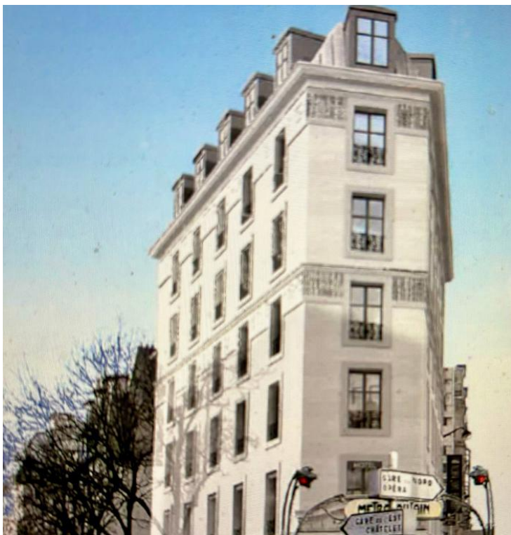
Best Western Hôtel Métropole Lafayette, Paris 9. Photo presse