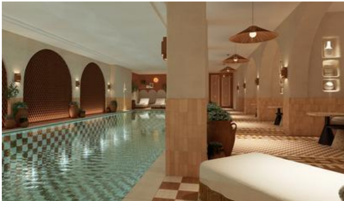
Hôtel Grand Coeur de Lion, Paris 5. Photo presse