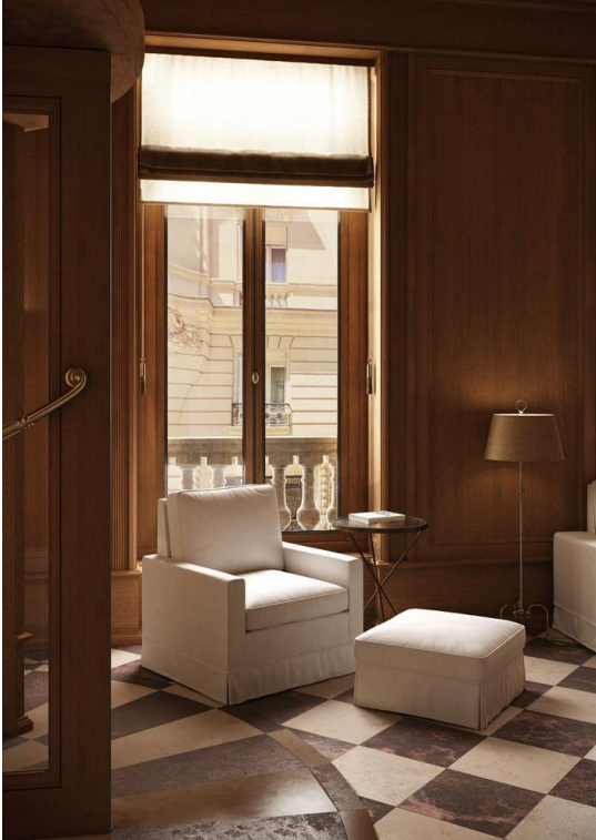
Hôtel Le Balzac, Paris 8.