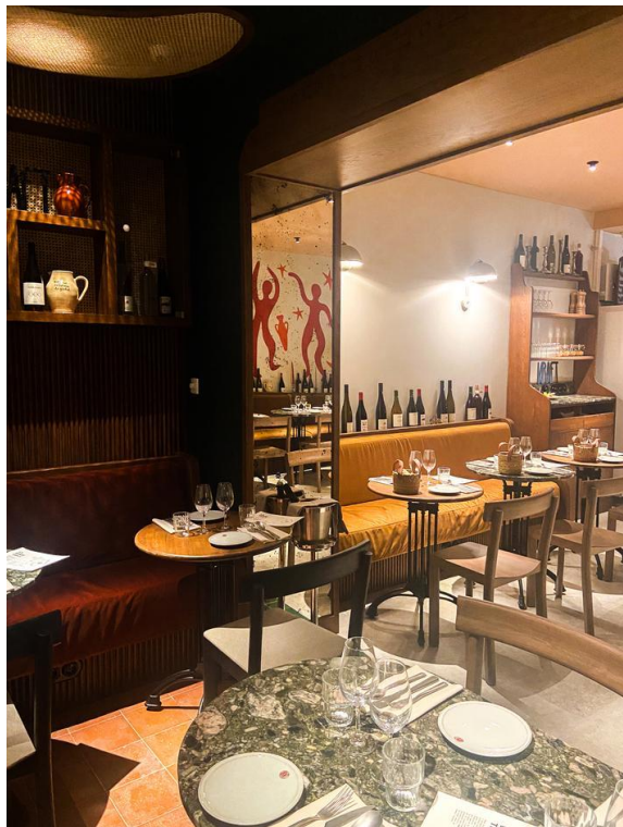
Hôtel Kraft, Paris 15.