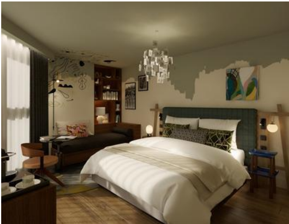
Hôtel Les Artistes, Paris 15.