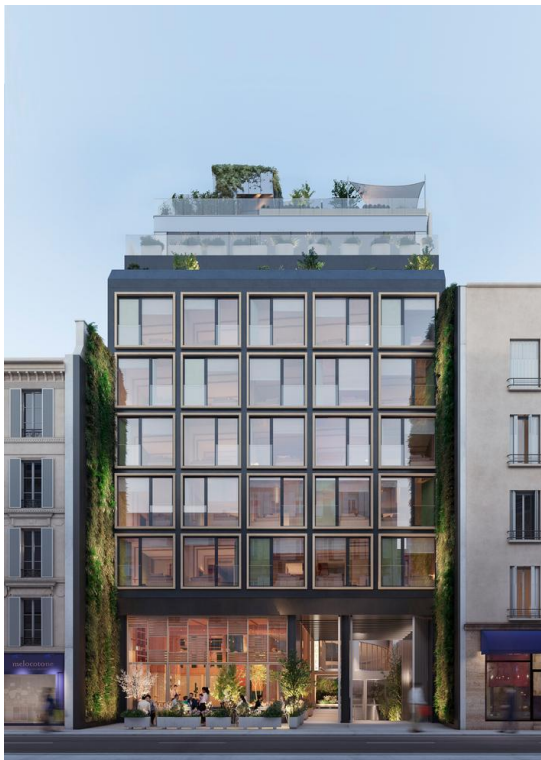
Hôtel La Fondation, Paris 17. Photo presse