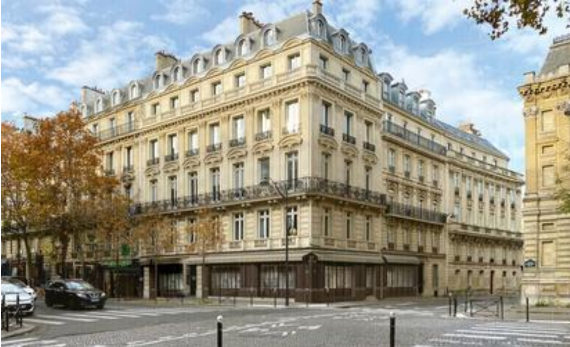
Hôtel L'aventure, Paris 16.