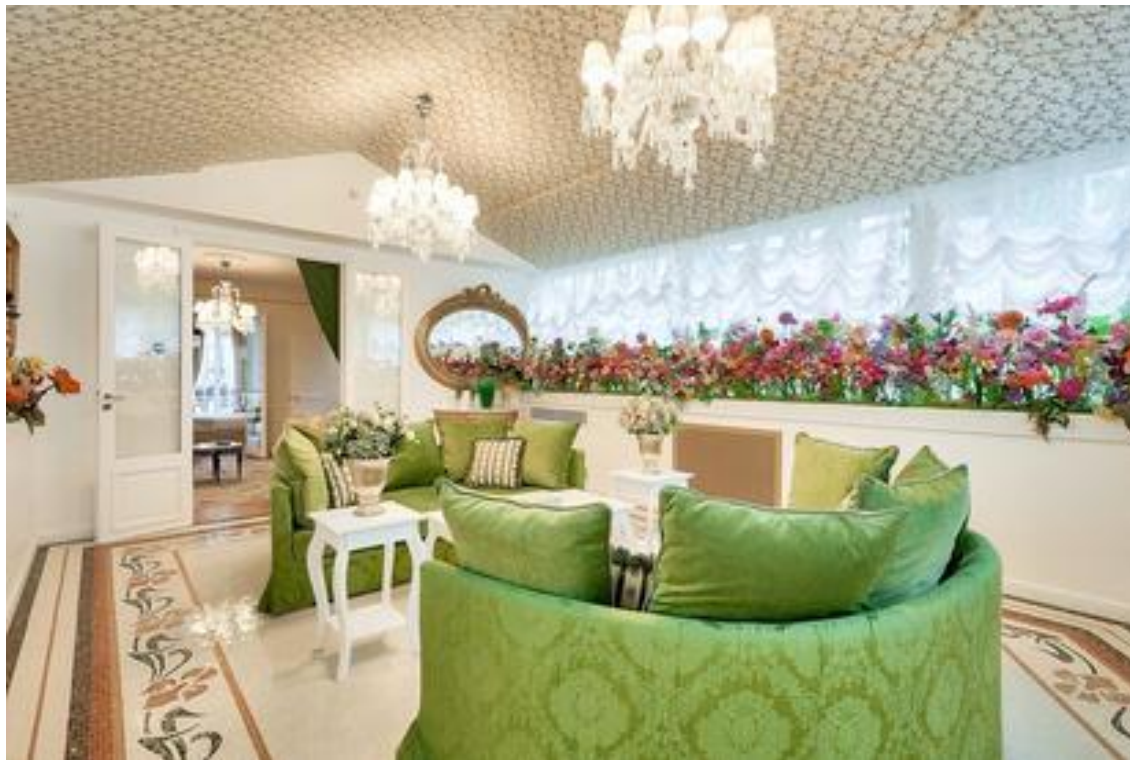
Hôtel L'impériale, Paris 16. Photo presse