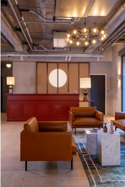
Hôtel Pilgrim, Paris 5.