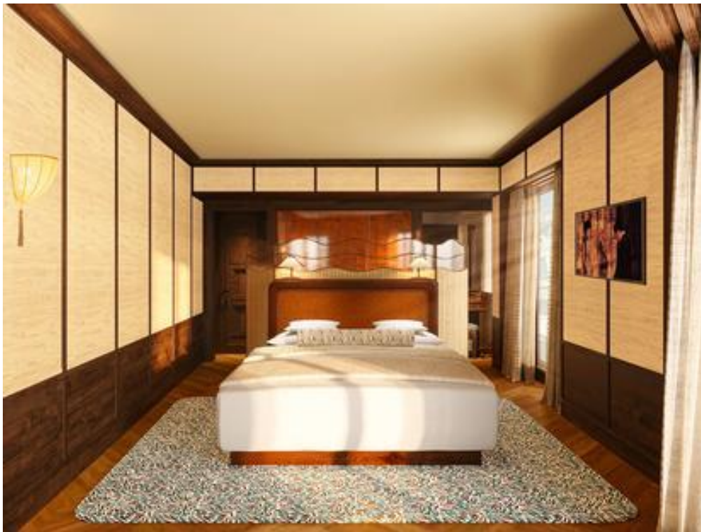
Hôtel Hana, Paris 2.