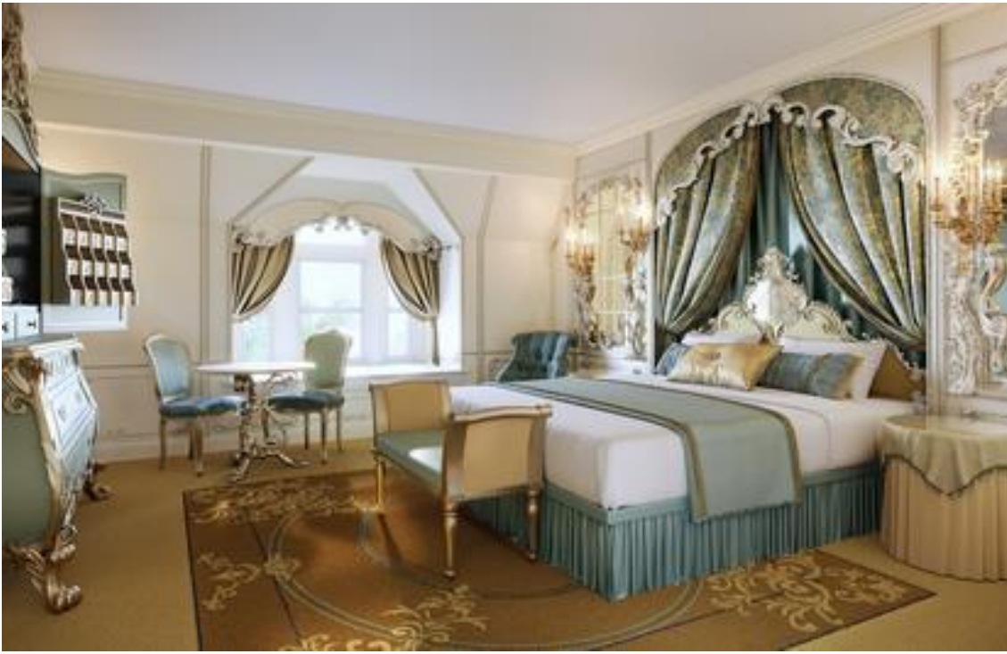
Disneyland Hôtel, Chessy.