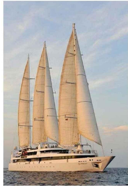
Ce trois-mâts de 88 mètres, avec 16 cabines, n'accueille que 32 passagers.

■■■ à l'occasion du dîner de gala, un ange passe sur les papilles : homard poché, salade pomme-céleri, crème brûlée onctueuse de courge au safran, côtelette d'agneau juteuse au romarin, tartelette au chocolat, truffe maison.