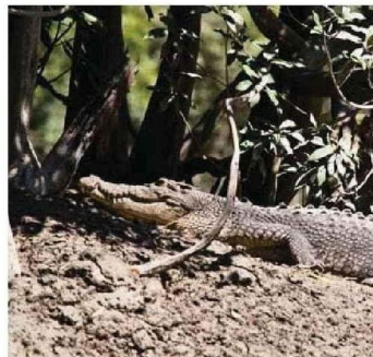
Un « salty », crocodile marin.

vit sur celles qui se présentent à nous. Les oiseaux y ont créé leur paradis ou leur enfer, peu importe, mais c'est le leur. Les îles Lacépède sont formées de quatre petites bandes de terre au sable grossier. Les oiseaux y échouent pour plonger, se reproduire, partir en migration. Et faire des trucs typiques d'oiseaux comme gazouiller, jacasser, lâcher des fientes. On revient ébloui