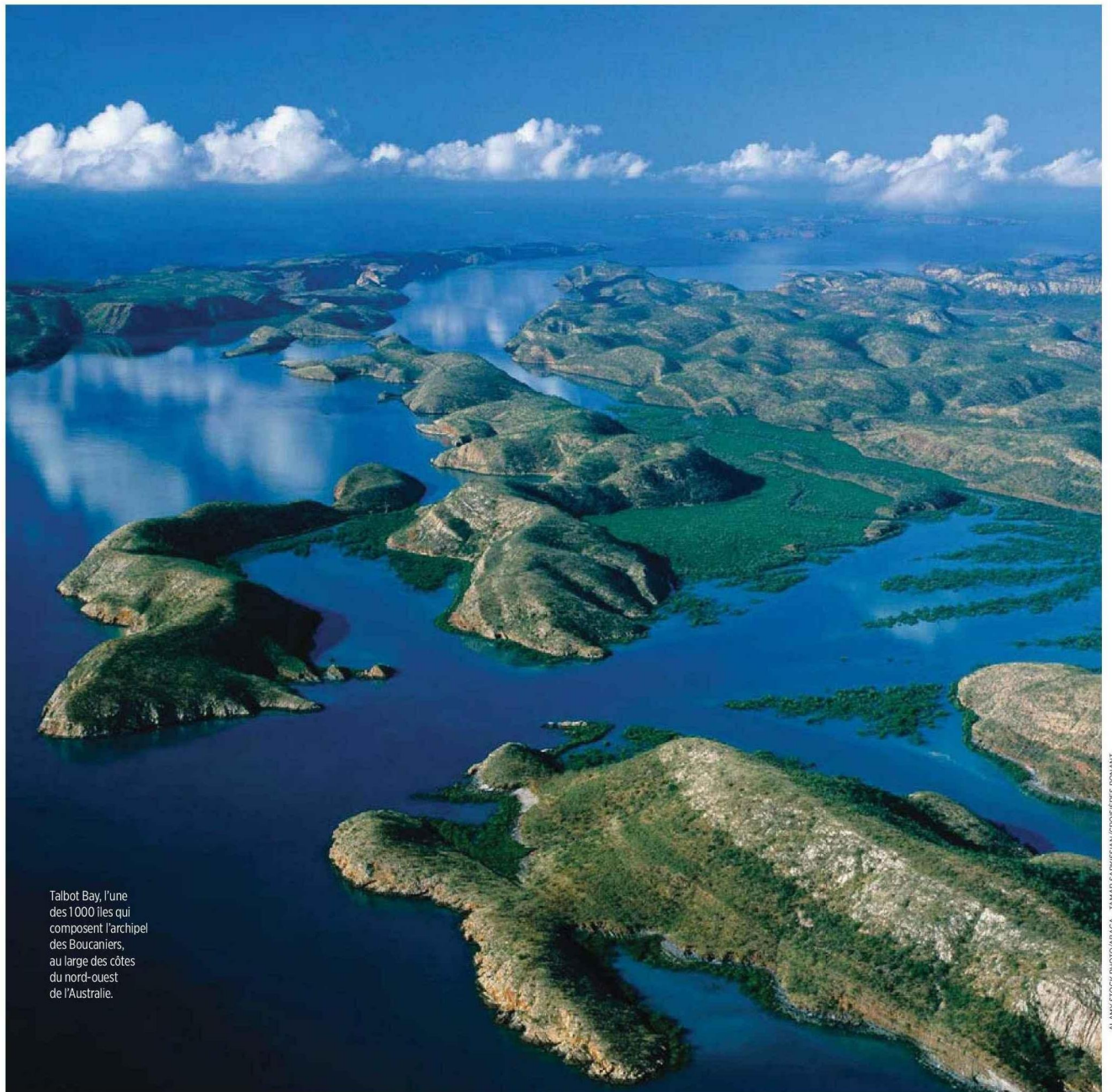
Talbot Bay, l'une des 1000 îles qui composent l'archipel des Boucaniers, au large des côtes du nord-ouest de l'Australie.