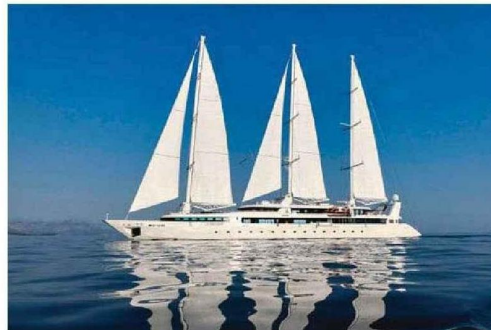
Le Ponant conjugue luxe et technologies vertes.

Le Point a embarqué à bord du Ponant pour une croisière au cœur du Kimberley australien, entre mystère aborigène et nature XXL. PAR NATHALIE LAMOUREUX