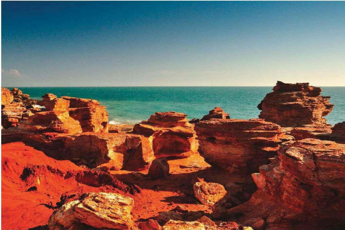
À Gantheaume Point, le long d'une pointe déchirée de rochers écarlates, on peut apercevoir à marée basse des empreintes de dinosaures.

glisse vers le large. Avant de partir, on a lu, parmi les livres recommandés dans le programme, La Longue Route , de Bernard Moitessier (Arthaud, 2012), et La Fabuleuse Histoire de Guirec et Monique , de Guirec Soudée (Arthaud, 2019), Monique étant la poule avec laquelle l'auteur a fait le tour du monde sur son petit voilier. Côté filmographie, Sans filtre , croisière de rêve qui vire au chaos, Palme d'or à Cannes en 2022, s'imposait, tout comme la minisérie Sauvetage en mer de Timor , qui raconte la panique s'emparant de cinq Australiens se revendiquant progressistes, généreux, quand ils se retrouvent face à un bateau à la dérive rempli de réfugiés.