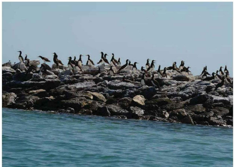
À 120 kilomètres au nord de Broome, les îles Lacépède, désignées comme réserve naturelle.

Croisière effectuée sur Le Ponant en juin 2023. Prochaines croisières dans le Kimberley : « Le Kimberley emblématique », à bord du Jacques-Cartier, 4 départs dès le 30 août 2024. 10 nuits en cabine double, à partir de 8 050 €/pers., pension complète et excursions incluses, à l'exception de la plongée. Autre croisière à bord du Ponant : « Les Caraïbes sous les voiles du Ponant », 8 départs de février à avril 2024. 7 nuits en cabine double, à partir de 6 510 €/pers., pension complète et sorties en Zodiac incluses. 04.91.16.16.27, ponant.com