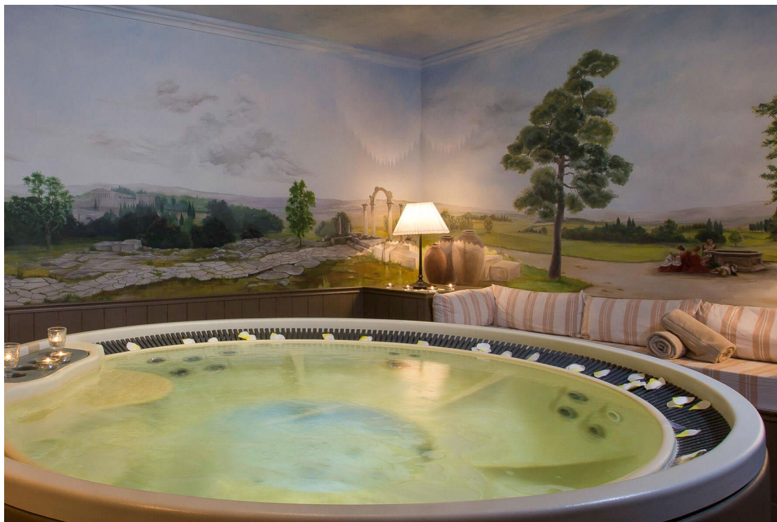
Hôtel avec spa privatif en France

Les chambres Signatures, dans les jardins, ont des salles de bains de maître et des terrasses privées pour des petits déjeuners tout en douceur. On a l'impression d'être dans une maison de vacances. On flâne, on nage, on boit un verre, on paresse, on lit un livre... On va au spa (griffé Nuxe) qui offre des services sur mesure : cabines de soin, sauna, hammam, jacuzzi, hydrojet, mises en beauté. Et surtout, il peut se vivre de manière totalement privative, en couple, en famille, en toute intimité. On profite d'un massage « Évasion Minérale aux pierres de Bourgogne » ou d'une « Escapade Amoureuse », conçus en exclusivité pour le spa privé. D'un Massage Détente, revêtu(e) d'huile. Le bonheur est au château !