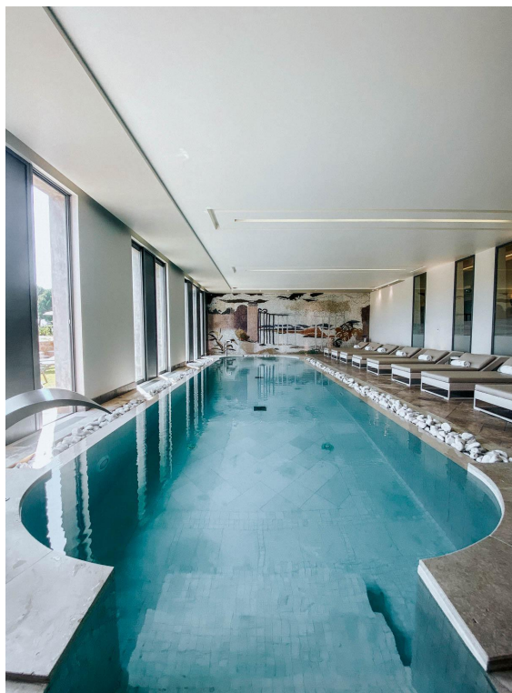
Piscine du spa

La table est gastronomique , une brasserie émerge des vignes . Certaines suites sont géantes, avec des salles de bain ouvertes XXL. On peut se lover dans des lits ronds, s'éclabousser dans des baignoires et des jacuzzis posés à même la chambre. Ou rejoindre un spa de 2 000 m 2 pour un moment à deux dans un univers de marbre, de pierre blanche, de verre et d'inox, de mosaïques géométriques. Deux cabines duo sont entièrement privatisables. Un spa dans le spa.