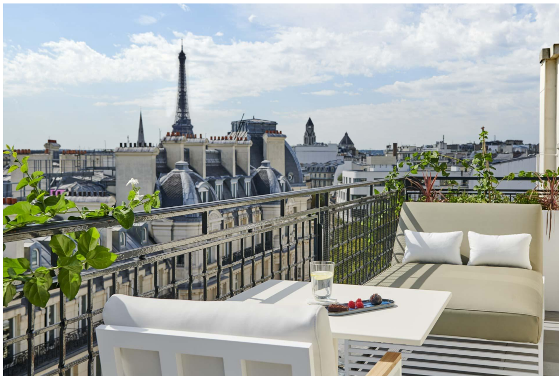
Lancaster Private Spa