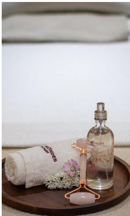
Hôtel & Spa Napoléon

La nouvelle version de l'hôtel avec spa privé s'appuie également sur une offre diversifiée. A commencer par un spa et un espace bien-être, ultime refuge. Rien de plus simple, il suffit de presser le bouton -1 de l'ascenseur. L'espace s'étire le long d'un bassin de nage de 15 mètres, de cabines de soins, d'espaces sensoriels, d'un sauna et d'un hammam. Un menu propose des rituels sur mesure, avec deux cabines simples, deux doubles et des thérapeutes dédiés. Une parenthèse holistique signée Cinq Mondes et Absolution . On teste le soin « signature Imperial » avant de partir pour un voyage en jouvence... Le spa est entièrement privatisable (250 € par heure) et permet d'accueillir jusqu'à 12 personnes. En journée comme en soirée.